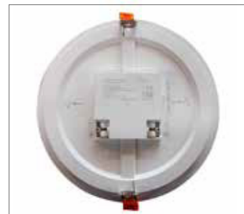
Fonction TCS (Température de Couleur Sélectionnable)